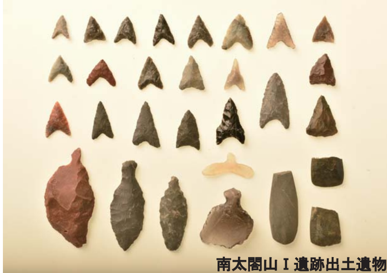
南太閤山Ⅰ遺跡出土遺物