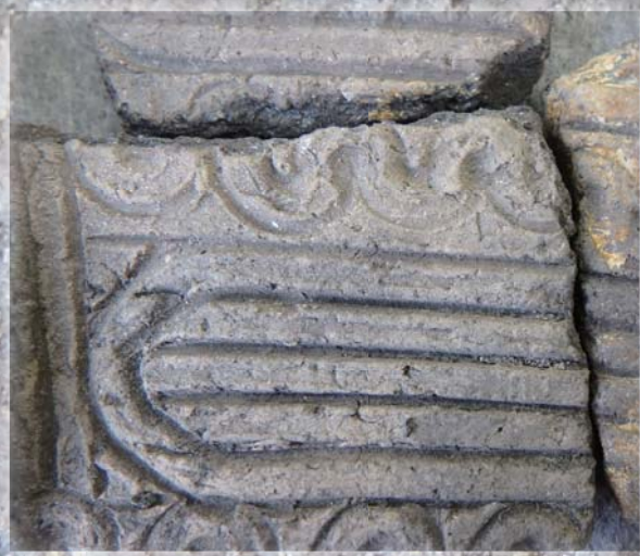
南太閤山 I 遺跡出土遺物